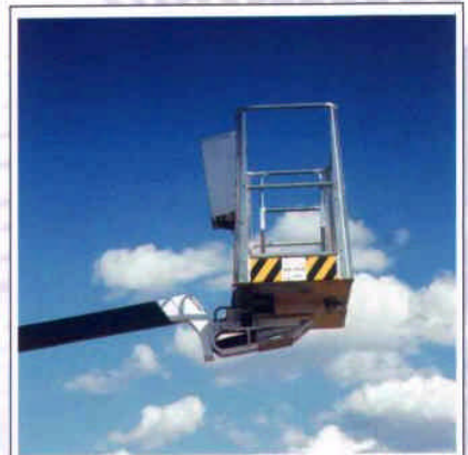
Schwenkbarer Arbeitskorb für exakte Arbeitsposition.