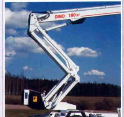
Überfahren verschiedener Hindernisse bis 2,5 m durch vertikal bedienbares Scherengelenk.