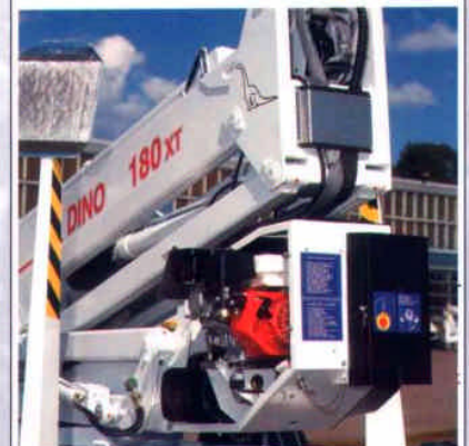
Die Bühne kann mit einem optionalen Aggregat ausgerüstet werden (Benzin oder Diesel).

DINO® und Dino Lift® sind von Dino Lift Oy registrierte Handelsmarken.