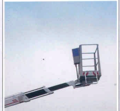
Der schwenkbare Arbeitskorb kann leicht jeder Arbeitsposition angepasst werden.