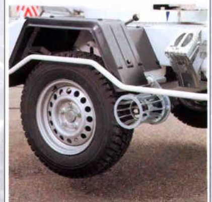
Der hydraulische Fahrtrieb (gehört zur Standardausstattung) garantiert optimale Beweglichkeit am Arbeitsplatz.