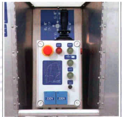
Ein Joystick für stufenloses Betätigen aller Bewegungen.