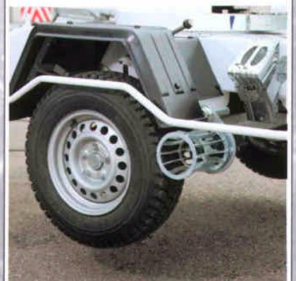
Der hydraulische Fahrtrieb (gehört zur Standardausrüstung) garantiert optimale Beweglichkeit am Arbeitsplatz.