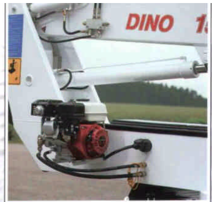
Das Aggregat als Option ermöglicht das Arbeiten auch ohne elektrischen Strom.