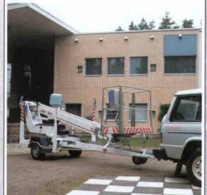
DINO 150T ist stabil, kompakt und sehr gut zu transportieren.