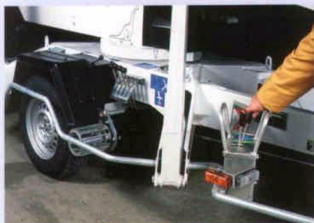
Der Fahrtrieb lässt sich bedienerfreundlich steuern.