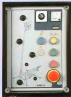
Die Steuerzentrale ist übersichtlich.