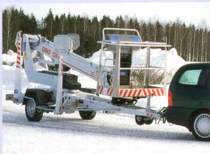
Mühevolle Transportierbarkeit ist bei DINO ein Begriff.

DINO® und Dino Lift® sind von Dino Lift Oy registrierte Handelsmarken.